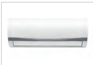
エアコン (室外機含む)