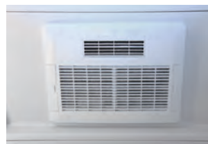
換気扇 (レンジフード、浴室暖房乾燥機を含む)